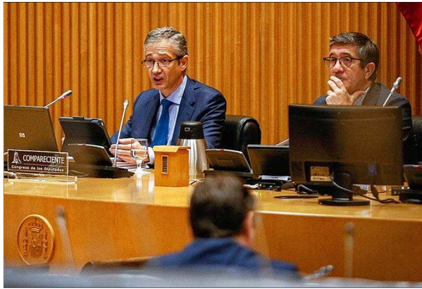
El gobernador del Banco de España, Pablo Hernández de Cos, ayer en el Congreso de los Diputados.

A esta última figura también se refirió Hernández de Cos al señalar que, si bien no tanto como en el caso del IVA, en Sociedades existe asimismo margen de mejora respecto a la