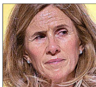
CRISTINA GARMENDIA FUNDACIÓN COTEC «Hay que prestar especial atención a la ciencia y a la investigación»