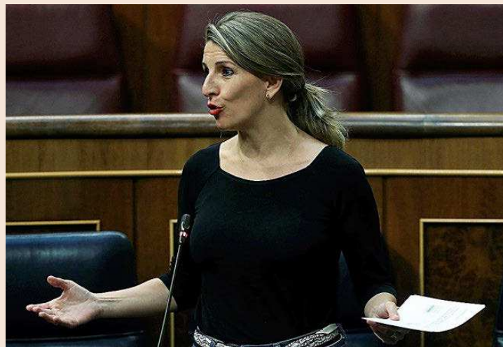
La ministra de Trabajo y Economía Social, Yolanda Díaz, en el Congreso de los Diputados.

En el caso de los trabajadores que permanezcan en el expediente, la última propuesta del Gobierno, hasta ahora, recogía una horquilla de exoneración de las cotizaciones sociales hasta el 30 de septiembre, como la siguiente