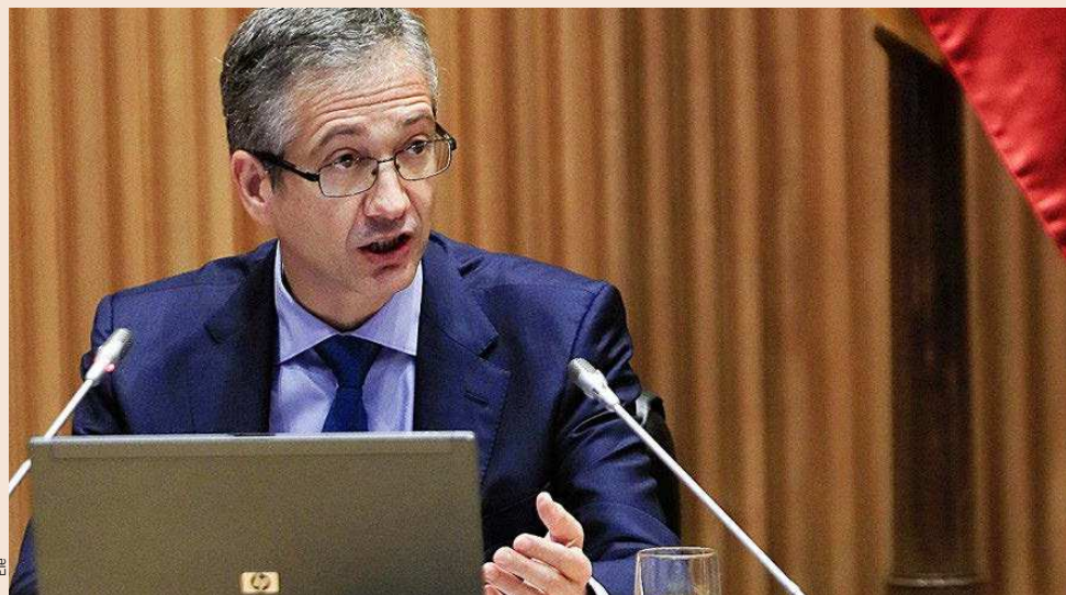
El gobernador del Banco de España, Pablo Hernández de Cos, ayer en su comparecencia en la Comisión de Reconstrucción del Congreso.

Con el actual desconfinamiento arranca la segunda etapa, donde, según Hernández de Cos, será necesario combinar dos objetivos: "apoyos a la recuperación y no efectuar una retirada prematura de los estímulos". Eso pasa por dotar de mayor poder de fuego a las líneas de crédito para empresas y ayudas a los hogares, pero también por extender los ERTE. Una medida de la que dependen más de cinco millones de trabajadores y donde el Gobierno busca un acuerdo contrarreloj con los agentes sociales antes de que expire la regulación de los ERTE, el próximo martes. Una retirada prematura de estos estímulos, advirtió Hernández de Cos, "aumentaría el riesgo de que la economía sufra daños duraderos". También recomendó revisar los procesos de reestructuración e insolvencia de empresas con dificultades financieras para que tengan acceso a un marco de reestructuración preventiva que les permita