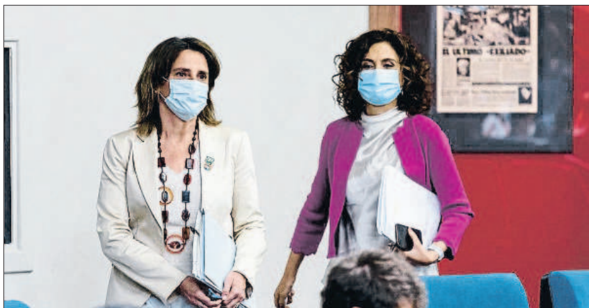
Teresa Ribera y María Jesús Montero, ayer en la Moncloa tras el Consejo de Ministros

Casado también reclama que se trace un plan jurídico ante cualquier rebrote del virus, porque no se puede volver a "decretar la excepcionalidad constitucional", a la vez que pide "un plan económico serio y eficaz antes de que el Gobierno se vaya de vacaciones", para lo que vuelve a ofrecer un "plan de choque para bajar impuestos", como ya han hecho Alemania e Italia. También pide que se extiendan los ERITE hasta fin de año y se aprueben ayudas "específicas y eficaces" al turismo y la automoción, y que el