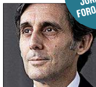
JOSÉ MARÍA ÁLVAREZ-PALLETE TELEFÓNICA «Hay que aterrizar las propuestas y poner a las personas por delante»

LOS PONENTES DE LA SÉPTIMA JORNADA DEL FORO DE LA CEOE