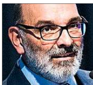
FERNANDO ABRIL-MARTORELL INDRA «La disrupción tecnológica, que permite un 'reset' industrial»