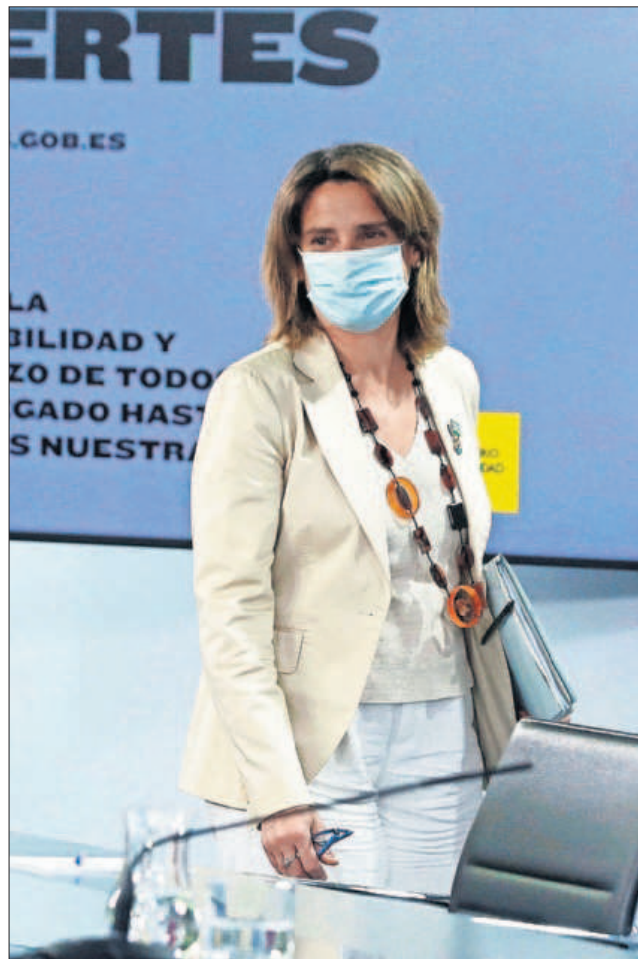
Teresa Ribera, ayer tras el Consejo de Ministros.

Las subastas eran una de las acciones que demandaba el sector. Defiende que la creación de un marco estable y algo predecible les ofrecerá seguridad para realizar inversiones, mientras que el Gobierno entiende que