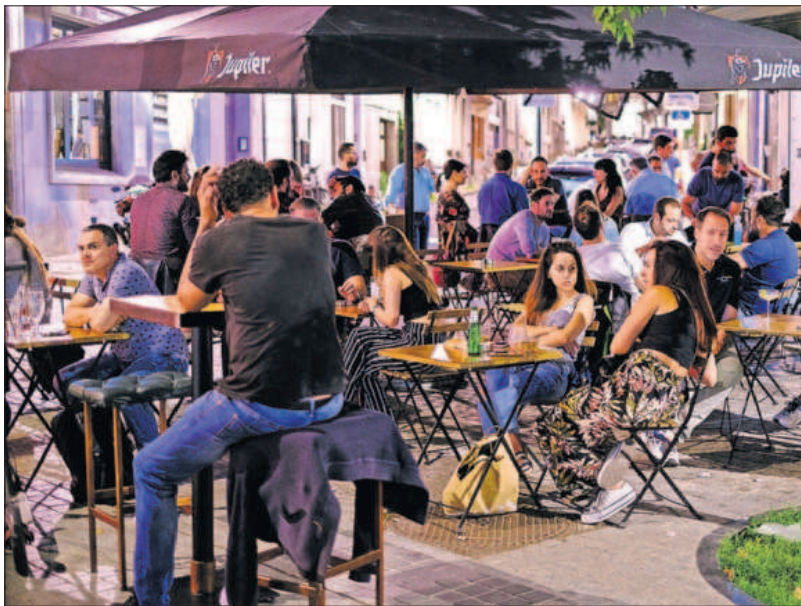
Clientes en la terraza de un bar en la plaza Jourdan de Bruselas, el pasado día 13.