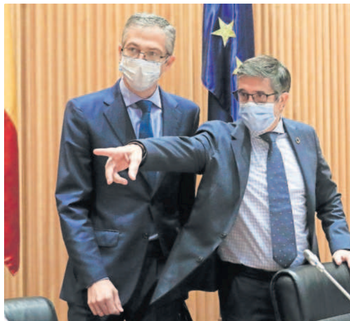
El gobernador del Banco de España, Pablo Hernández de Cos, conversa con el presidente de la Comisión de Reconstrucción Social y Económica, Patxi López.

La Comisión, en todo caso, no agrupará todas las voces políticas después de que Vox anunciara ayer que la abandona por considerarla un instrumento de "exculpación" del Gobierno, a lo que este replicó que el grupo se va sin hacer propuestas.