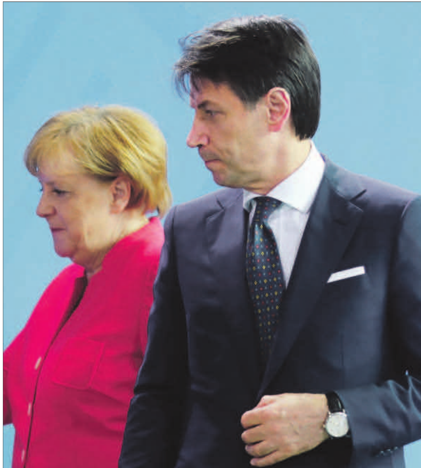
En primer término, el primer ministro italiano, Giuseppe Conte, y la canciller alemana, Angela Merkel.

Por sorpresa, el único que apoya la reducción del IVA es el líder de la oposición Matteo Salvini, mientras el ministro de Economía, el