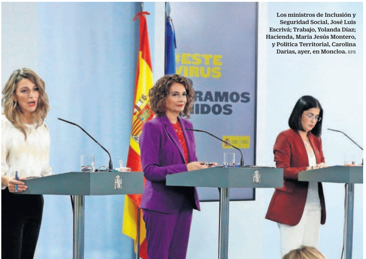
Los ministros de Inclusión y Seguridad Social, José Luis Escrivá; Trabajo, Yolanda Díaz; Hacienda, María Jesús Montero, y Política Territorial, Carolina Darias, ayer, en Moncloa.