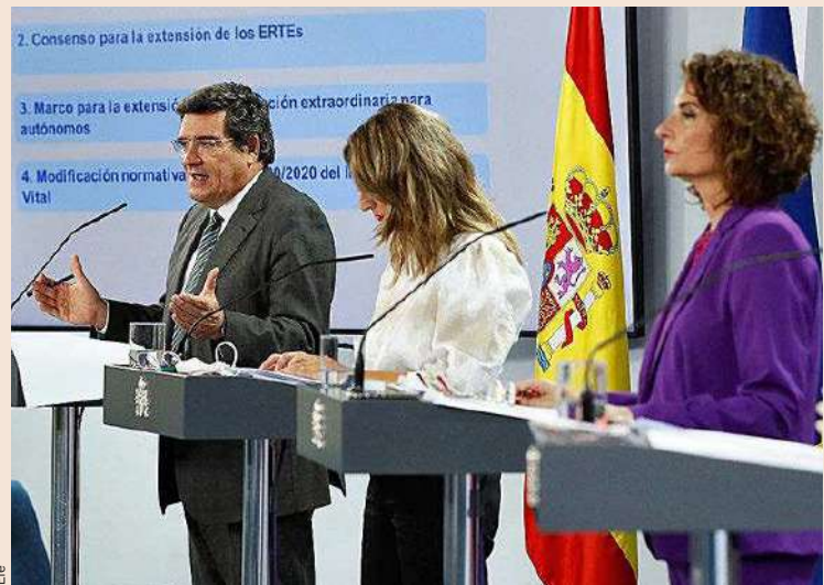
Los ministros José Luis Escrivá, Yolanda Díaz y María Jesús Montero, ayer, tras el Consejo de Ministros.

Hay que recordar que en un ERTE, los trabajadores tienen prestación por desempleo, tanto si es en jornada completa, como con reducción de la misma, pero la empresa se compromete a preservar el puesto de trabajo, mientras dure la crisis de la