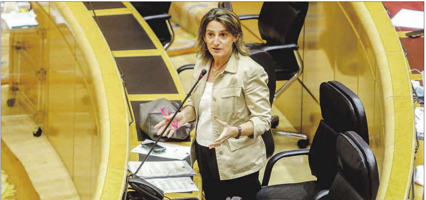
La vicepresidenta cuarta del Gobierno y ministra para la Transición Ecológica, Teresa Ribera.