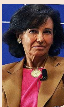
Ana Botín, presidenta de Santander.

Representantes de estas grandes empresas, gerentes de riesgos y seguros en su mayor parte, se reunieron ayer para diseñar una estrategia común ante "un entorno de mercado extremadamente duro, con subidas indiscriminadas de primas y restriccio-