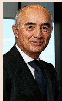
Rafael del Pino, presidente de Ferrovial.