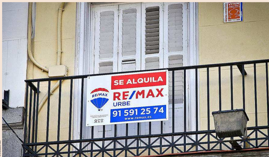
PSOE y Unidas Podemos llevan meses negociando la ley de vivienda, encallada por las diferencias en el control de alquileres.

Fuentes del Ministerio explican que no hay novedades. Las reuniones continúan y los equipos de Podemos y el PSOE se darán nueva cita en los próximos días, pero las di-