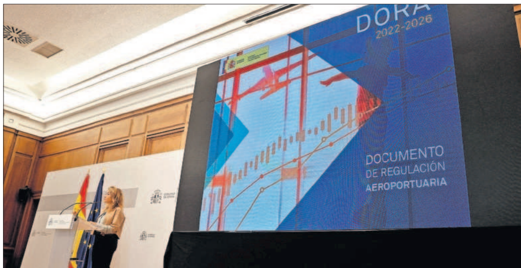
Raquel Sánchez presentó ayer el Documento de Regulación Aeroportuaria (DORA II) para 2022-2026 en la sede del ministerio.