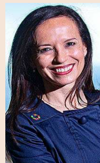
Beatriz Corredor, presidente de Red Eléctrica.

Las asociaciones de gerentes de riesgos AGERS e IGREA pilotan las reivindicaciones