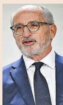
Antonio Brufau, presidente de Repsol.