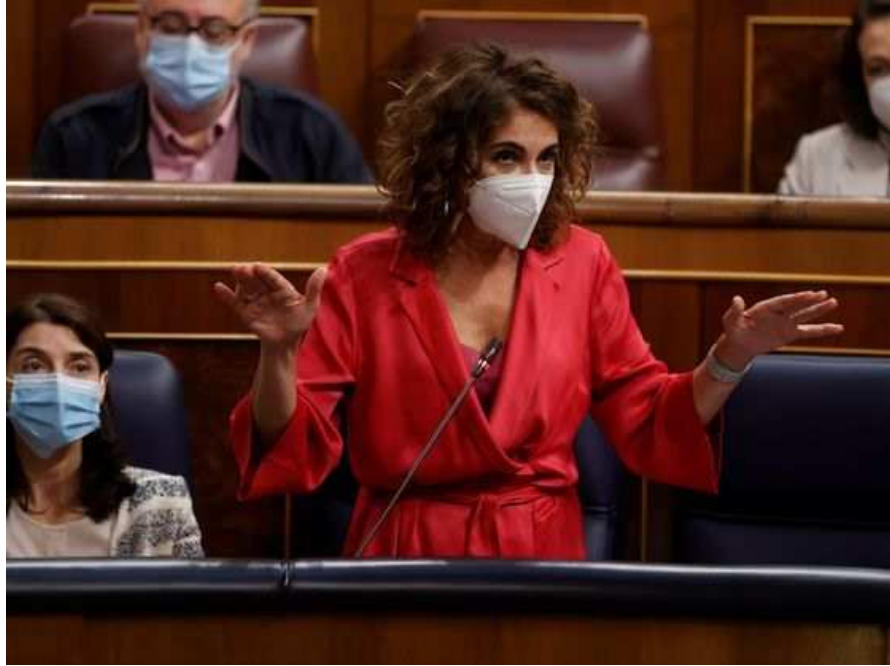
La ministra de Hacienda, María Jesús Montero, durante su intervención este miércoles en la sesión de control al Gobierno.

El departamento justifica su negativa a las exigencias de Unidas Podemos en la mesa de negociación de las cuentas por la oposición de Bruselas a reducir este impuesto