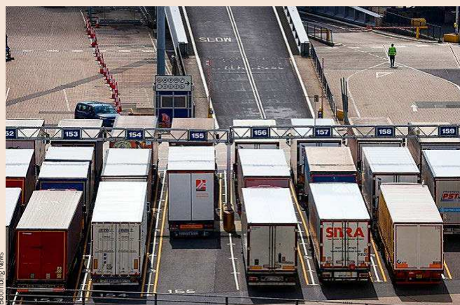
El Gobierno británico repartirá de urgencia 5.000 visados para camioneros extranjeros.

Los cálculos apuntan a que en Reino Unido faltan dos millones de trabajadores. A las 100.000 plazas de camionero vacantes se suman las disponi-