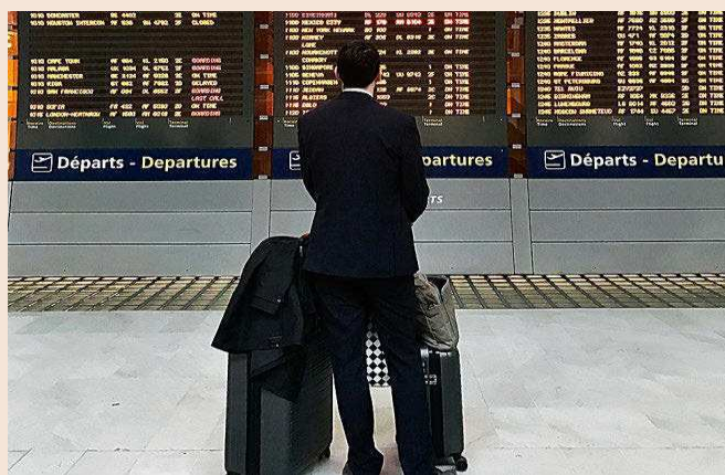
La vuelta de las ferias y congresos animará la recuperación de los viajes de negocios.