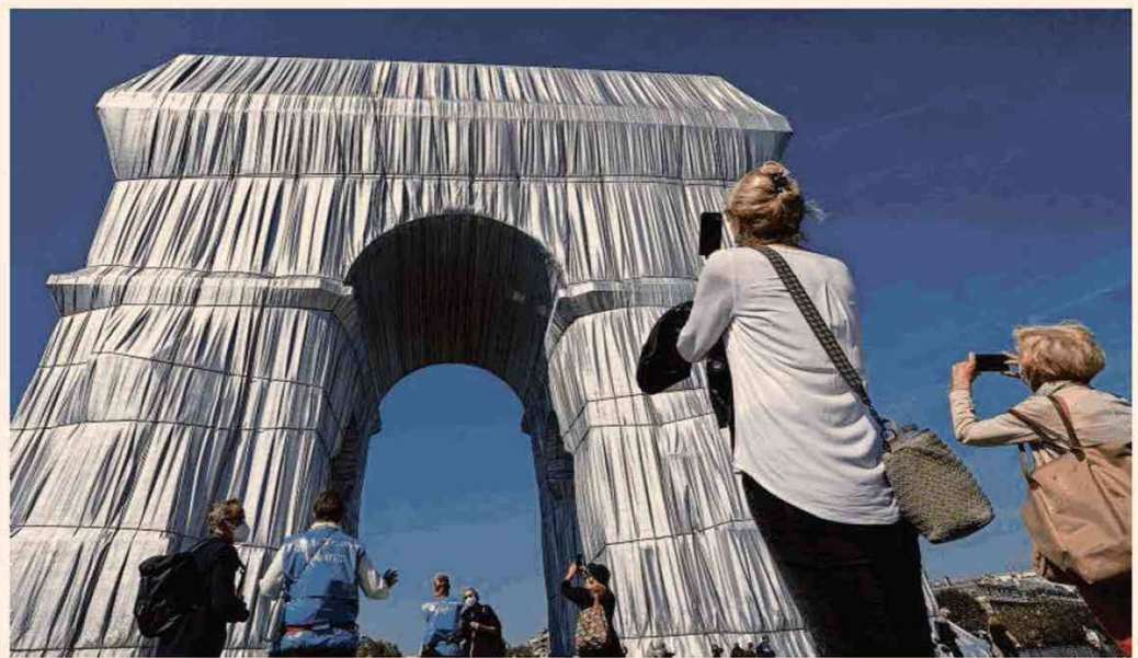
Tourists at the Arc de Triomphe, Paris. Figures on economic activity in September suggest people feel emboldened by high Covid-19 job rates

1.9 percentage points of the eurozone's 2.2 per cent growth in the second quarter, Chiara Zangarelli of Nomura forecast that the bloc's economic recovery would continue and predicted a 2.3 per cent expansion in the third quarter.