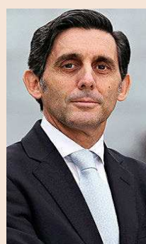
José María Álvarez Pallete, presidente de Telefónica.