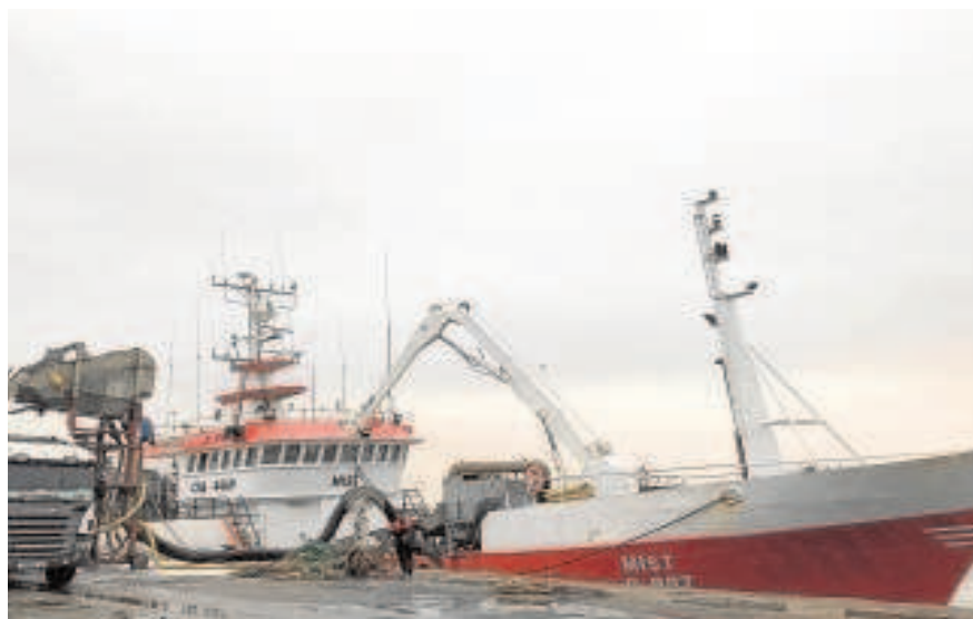
Marruecos también saldría perjudicado con el fallo del TUE // ABC

A esta posibilidad se remiten tanto la patronal pesquera Cepesca como la Confederación General de Empresas Marroquíes (CGEM). En juego está el acceso a unos caladeros, principalmente localizados en el Sahara Occidental, en el que faenan 92 embarcaciones españolas sobre un total de 128 barcos europeos con origen en Andalucía, Canarias y Galicia. La flota española pescó en el primer año de vigencia del actual acuerdo (2019) 496,2 toneladas por 525,4 toneladas del segundo (2020). Para este año y el siguiente, si se mantiene el actual 'statu quo', la flota española pescará 583,8 toneladas cada ejercicio. Si bien en una