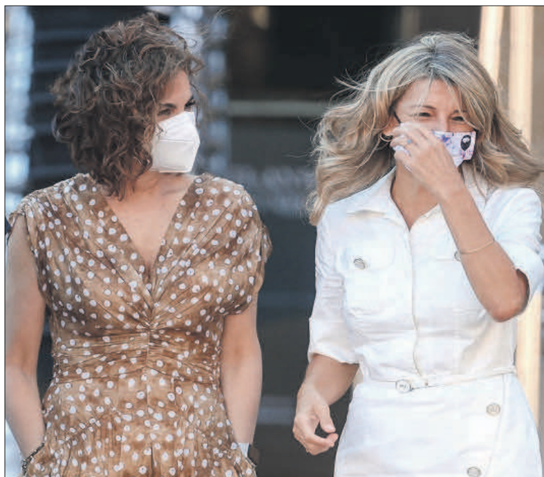
La titular socialista de Hacienda, María Jesús Montero, y la vicepresidenta segunda de Podemos, Yolanda Díaz.

Este miércoles, la vicepresidenta hacia hincapié en su voluntad de negociar los Presupuestos, y muy especialmente en su agenda para sacar adelante los temas sociales que más preocupan a Podemos, en-