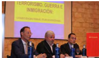
Ignacio Fernández, Rafael Salas y Pedro Baños en la conferencia en Es Baluard. abef

Un atentado terrorista perpetrado por yihadistas es "difícil" en España o Mallorca, pero "no imposible". Esta es la postura del coronel Pedro Baños, exjefe de Contrainteligencia y Seguridad del Cuerpo de Ejército Europeo, que dio ayer en una conferencia en Es Baluard. Las razones de ello son que la probabilidad de que se produzca un ataque en "otro lugar de la Unión Europea o incluso Rusia" son "muy superiores".