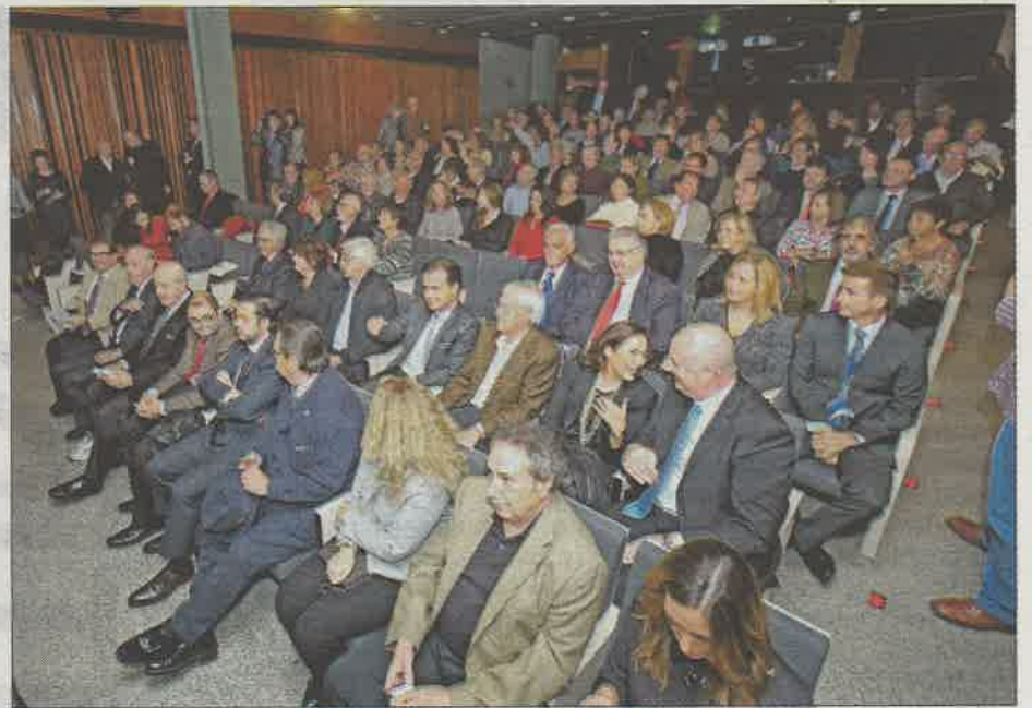
El acto contó con la presencia de un público numeroso. GUILLEM BOSCH