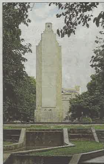
Monumento de sa Feixina.

Ciudadanos favorables a que no se derribe el monumento de sa Feixina, que recuerda a los marinos que fallecieron en el crucero Baleares —sin ser un homenaje al buque franquista—, sugieren que de la misma forma que el memorial se erigió mediante suscripción popular, que sean los defensores de su demolición quienes sufraguen los gastos, a través también de una campaña de captación de fondos. Opinan que, si no es protegido por el Consell, el derribo no debe pagarse con dinero público.