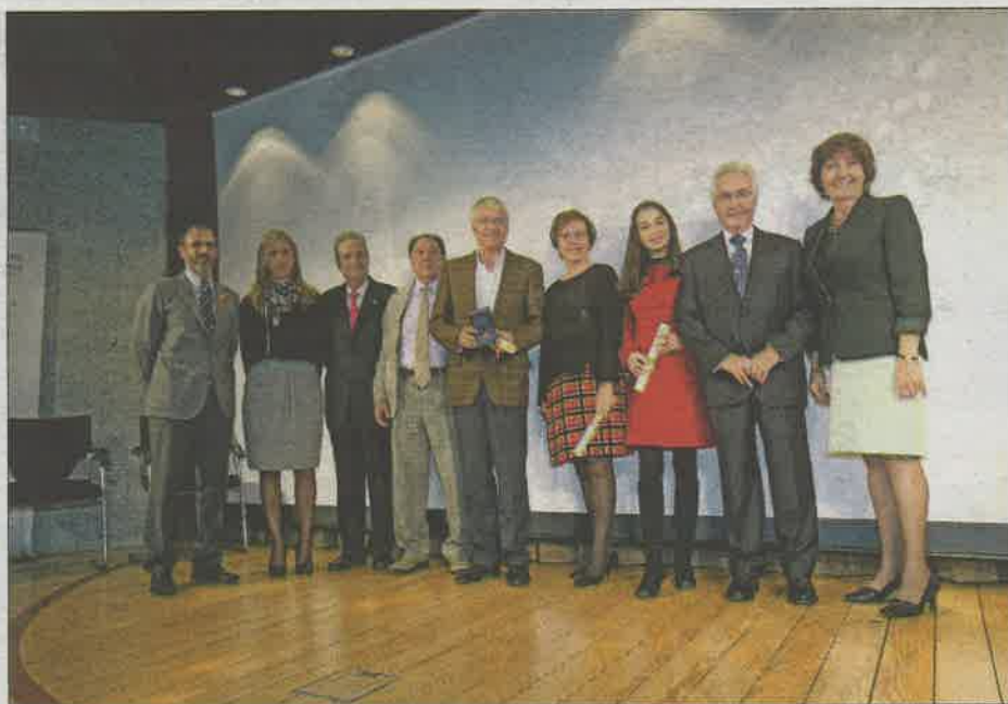
Todos los premiados posaron durante la ceremonia. GUILLEM BOSCH

Recordó que “los objetivos de los atentados terroristas están perfectamente definidos”, y que “los que manejan los hilos de los ataques yihadistas no son cuatro locos, sino gente muy inteligente que tiene las ideas muy claras”. Explicó que pretenden atacar a las fuentes de ingresos para desestabilizar a los países, “provocar descontento” y “buscar eco mediático” atacando a “nuestros principios y valores que ellos consideran condenables”.